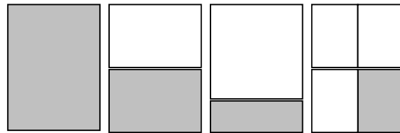
フルページ 1/2 ページ ページ下部 1/4 ページ

版下: 完全版下 フルページ : 210mm x 297mm 1/2 ページ : 186mm x 130mm ページ下部 : 186mm x 70mm 1/4 ページ : 85mm x 130mm Screen Line: 150dpi